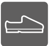
シューズボックス