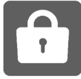
セキュリティ完備