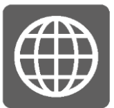
インターネット設備