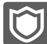
ALSOKみまもりサポート