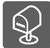
郵便物荷物預かり