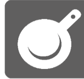
共有調理スペース