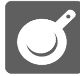
共有調理スペース